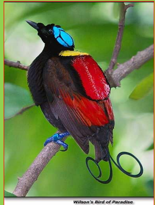
Wilson's Bird of Paradise